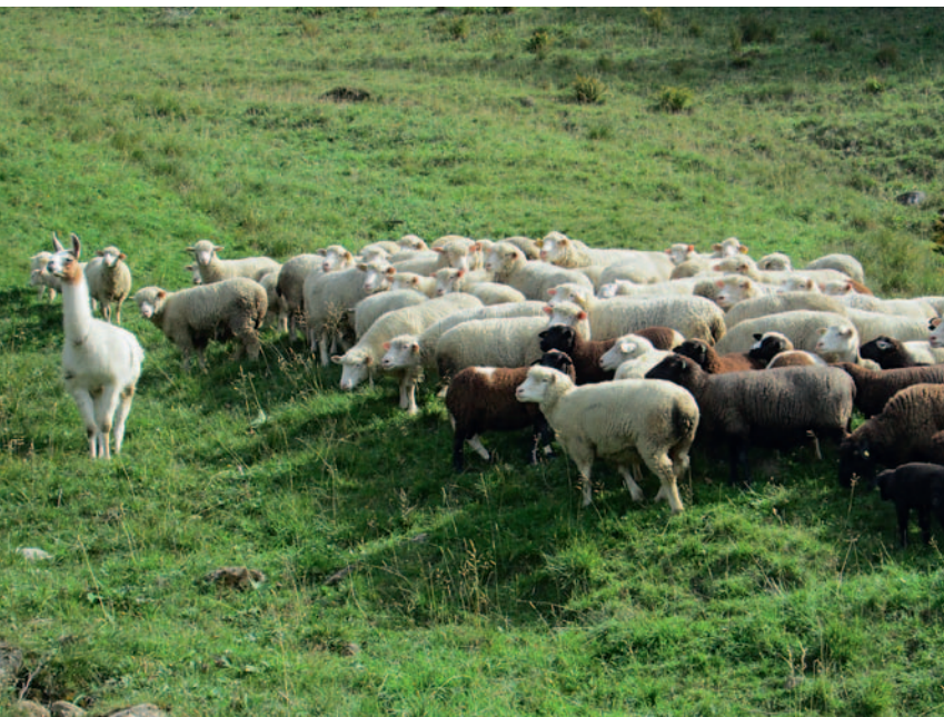
Typische Haltung des Lamas beim Erkennen einer Störung. Posture typique d'évaluation d'un problème.

Dans les exploitations d'estivage sélectionnées, des observations d'un jour ont été menées au printemps et en automne pour documenter le comportement du lama ainsi que son interaction avec les moutons. La dynamique entre les moutons et le lama est influencée par des facteurs très divers. Ainsi, les races de moutons, la taille du troupeau, la topographie et le type de végétation ainsi que l'homogénéité et la conduite du troupeau constituent un ensemble complexe de variables. Dans le relevé des données, on a tenté de quantifier la vigilance au moyen du rapport entre les périodes d'alimentation et d'observation. On a également inscrit les déplacements des lamas par rapport aux moutons ainsi que l'état d'alerte et la durée de séjour aux différents emplacements. Afin