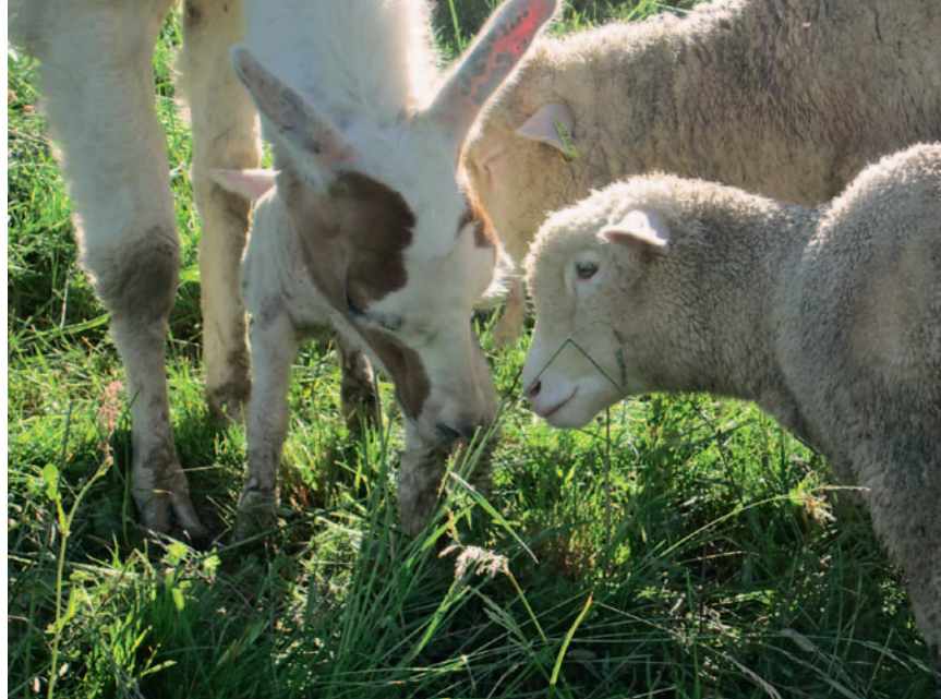
Die Bindung zwischen Schaf und Lama entwickelt sich am Besten in kleineren Weidekoppeln. Le lien entre les moutons et le lama se développe au mieux dans des petits parcs.

Das kleinstrukturierte Voralpengebiet mit mehrheitlich kleinen Talbetrieben ist geprägt von relativ intensiver landwirtschaftlicher und touristischer Nutzung. Dadurch können verschiedene Nutzungskonflikte entstehen, die unter anderem auch dem Einsatz von Herdenschutzhunden Grenzen setzen. Das Lama als Herdenschutztier löst hingegen kaum Konflikte mit Wanderern, Jägern oder Nachbarn aus und ist ausserdem ein robustes und kostengünstiges Nutztier. Im Frühling 2012 konnte mit einer breit abgestützten Trägerschaft das Projekt gestartet werden. So wurden in den Kantonen Luzern und Waadt vier Schafbetriebe ausgewählt, wo Lamas im Frühling in die Herden integriert wurden (Kasten «Pilotprojekt 2012-2013», Seite 12).